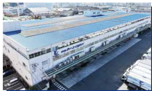
本社物流センター

広島東(物流) TEL:082-886-3311 FAX:082-884-5544