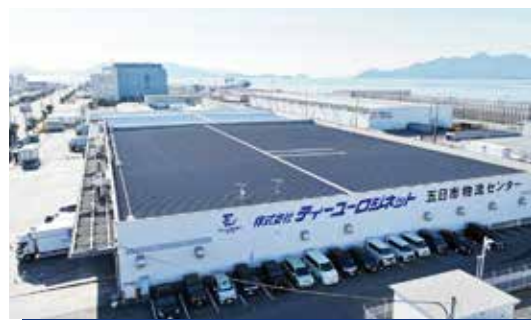
五日市物流センター

五日市営業所 TEL:082-925-0125 FAX:082-925-0121