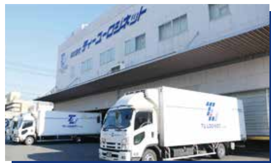
広島東物流センター