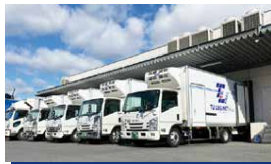
定温物流センター